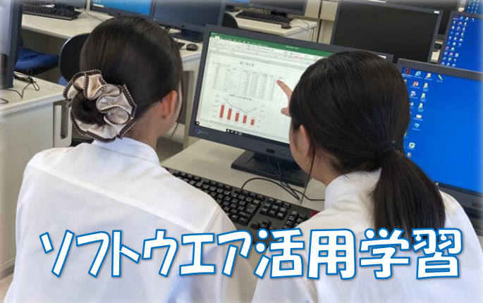
ソフトウェア活用学習

ビジネスに関する幅広い知識・技術を習得させ、地域と密着しながら、地域の活性化や地域産業の発展に貢献できる人材を育成します。