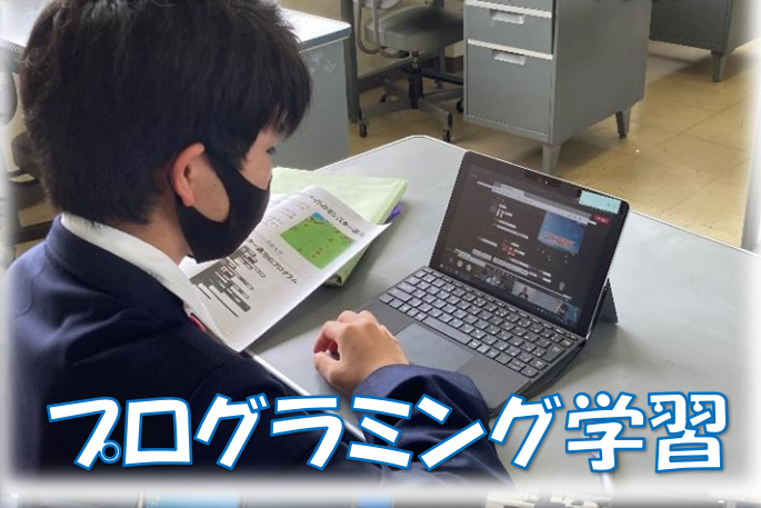
プログラミング学習