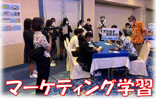
マーケティング学習